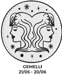
GEMELLI 21/05 - 20/06