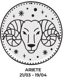
ARIETE 21/03 - 19/04